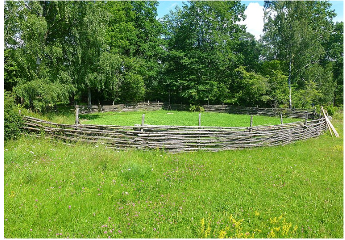
Rekonstruerad fläteshägnad vid Bögs gård .