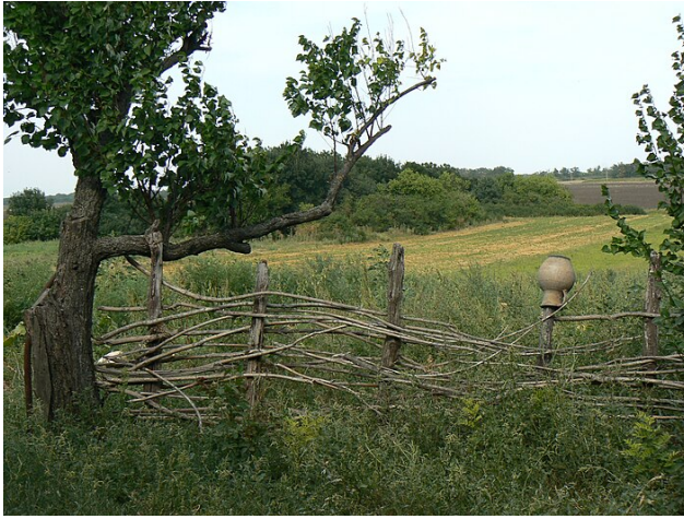
Flätverksgårdsgård i Ukraina .