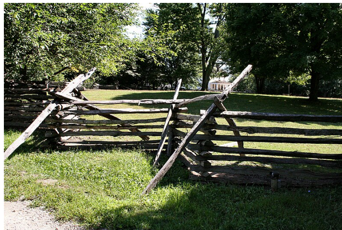
Amerikansk gårdsgård av typen split-rail fence .