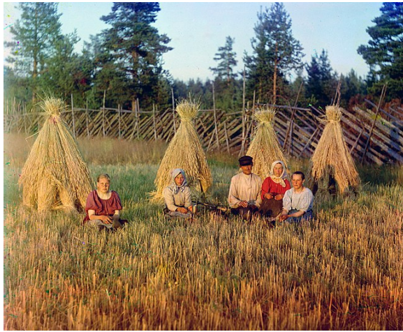
Hankgårdsgård i norra Ryssland . Foto av Sergej Prokudin-Gorskij , 1909