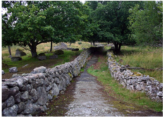
Exempel på en stengårdsgård.