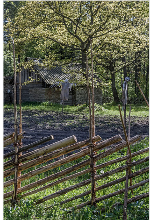
Hankgärdsgård vid gårdstunet, Estland.

På Gotland - där benämningen är "bandfast tun" (gotländska) - används istället för vidjor bandar . Detta är klenare enesgrenar på ca 120 cm där endast riset i toppen lämnas kvar. Dessa värms över en eld och vrids fast mellan störparen och därefter läggs trodren vilande på dessa. På så sätt skapas ett stabilt och, vid bra materialval, hållbart staket som står sig i upp till 40 år. Gärdesgårdar förekommer numera både som staket omkring privata trädgårdar och som stängsel i kulturhistoriska miljöer. Enligt gammal folktro ska eneruskorna vridas ut från gården, för att hindra trolldom och andra förtretligheter att komma in.