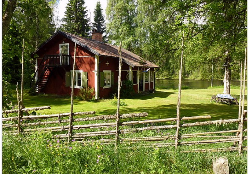
Svensk, klassisk gårdsgård vid Nyhammar .

Stengårdsgårdar är vanliga där det finns tillräckligt ur åkrar avlägsnade stenar eller råder brist på trä.